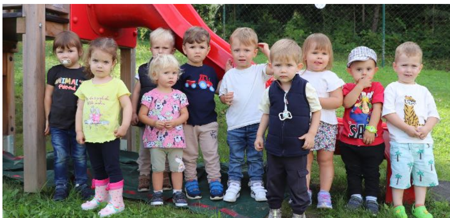
Die Kinder der Kinderkrippe freuen sich über ihre neue Rutsche.

Obwohl am Sommerfest einige Kinder in den Kindergarten verabschiedet wurden, wächst die Anzahl der Krippenkinder trotzdem laufend weiter. Themenschwerpunkte in der Arbeit sind die Eingewöhnungsphasen von neuen Kindern, der Herbst und die Suche nach den letzten Beeren bzw. Früchten, die der Garten noch zu bieten hat.