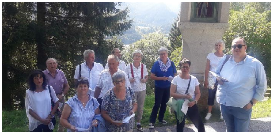
Während einige Mariazell-Wallfahrer am Nachmittag in der Kirche waren, fanden sich auch einige zum gemeinsamen Kreuzweg zusammen.

In den letzten Monaten organisierte die Pfarre Wallfahrten zur Wandermuttergottes nach Kaisersdorf, zur Jubiläums-Wallfahrt nach Mariazell und mit den Ministranten zur Pfarrkirche nach Straden.