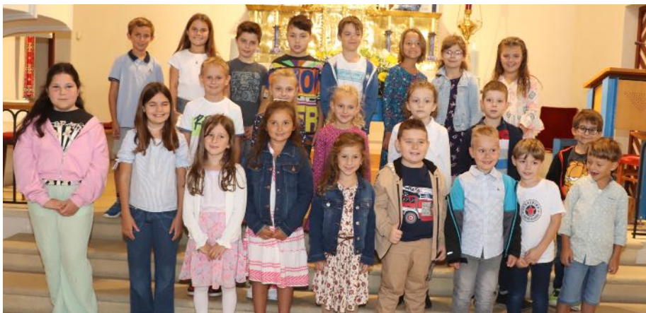
Den Schulbeginn feierten die 23 Kinder die Volksschule auch mit einem gemeinsamen Gottesdienst in der Kirche.