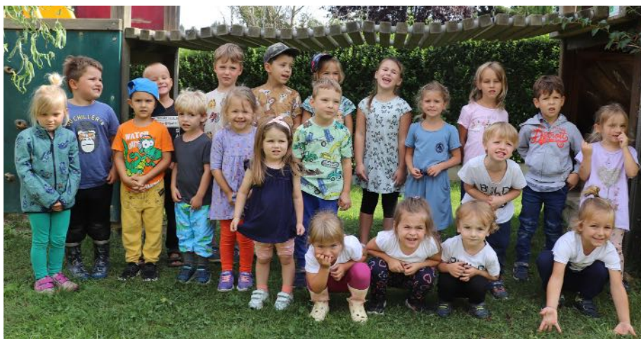
Die Schwerpunkte im neuen Kindergartenjahr liegen im Lernen über Naturschutz und die digitale Welt um uns herum.

Im neuen Kindergartenjahr erfahren die Kinder wieder viel zu den Themen Natur- und Umweltschutz und Nachhaltigkeit, welche den Kindern durch praktische Übungen wie z. B. regelmäßiges Müll sammeln nähergebracht werden sollen. Weiters setzen die Pädagoginnen heuer auf Sprachförderung durch digitale Medien, wobei ein neues digitales Medienpaket den Kindern ein langsames Herantasten an die Materie ermöglichen soll.