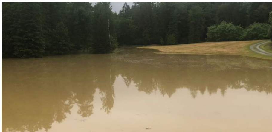
Die 2014 errichteten Hochwasserrückhaltebecken konnten im Sommer eine neuerliche Überflutung der Gemeinde verhindern.

kleineren Auspumparbeiten sowie zu einem durch einen Biberdamm verursachten Rückstau am „Güttenbach“ auf dem Hotter von St. Michael ausrücken, da dadurch der Güttenbacher Transportkanal geflutet wurde.