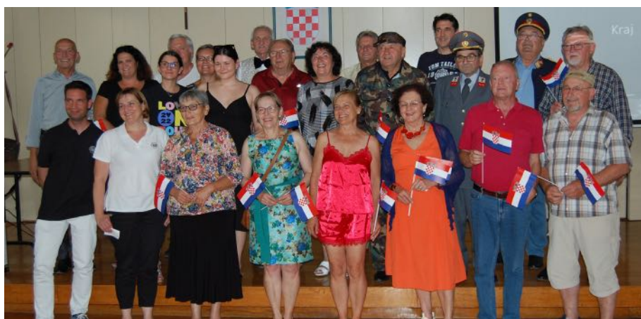
Das „Veteranen-Ensemble“ der Dugava präsentierte sich und unsere Gemeinde im Juli in Zagreb.

den, da sich zu wenige Kinder dafür interessiert haben. Die nächste Gelegenheit für die Kleinsten, Theaterluft zu schnuppern, gibt es im Fasching, wenn nebst Sketchen mit Erwachsenen auch einer mit Kindern einstudiert werden soll. Interessierte können sich gerne bei den Vereinsverantwortlichen melden.