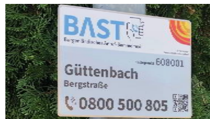
Diese Tafeln im Ortsgebiet kennzeichnen die BAST-Haltepunkte

dieses System am relevantesten. Die Pläne der Haltepunkte liegen im Gemeindeamt auf bzw. können auf der Homepage der Gemeinde eingesehen werden.