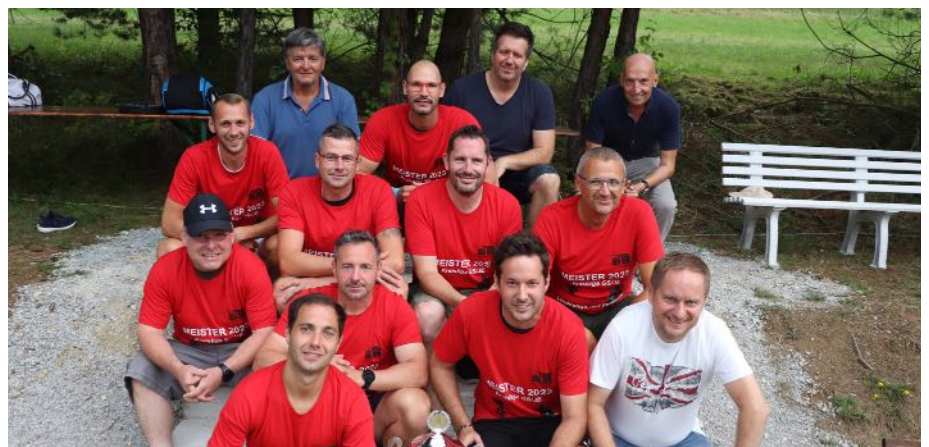
Das Herren Team der Allgemeinen Klasse schaffte den Aufstieg.